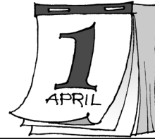
Geburtstage der Klasse 3a