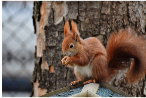
Abbildung 3: Ein Europäisches Eichhörnchen ( Sciurus vulgaris ). (Ralphs_Fotos, 2023), bearbeitet.

Ein Argument besteht aus drei Teilen: Behauptung, Begründung und Beleg.