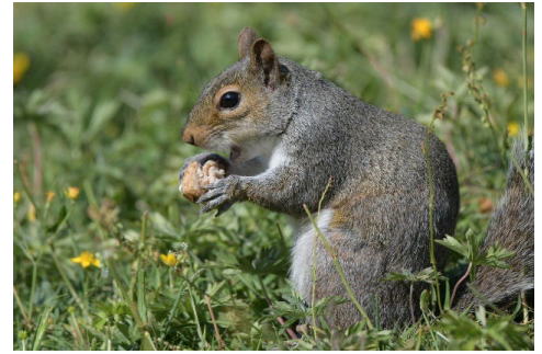
Abbildung 4: Ein Grauhörnchen ( Sciurus carolinensis ). (Mayukh_karmakaR, 2023), bearbeitet.

Die Behauptung (auch These genannt) wird kurz und möglichst in einem Satz aufgestellt.