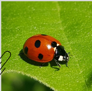
Abbildung 1: Siebenpunkt-Marienkäfer. (Brett_Hondow, 2016), bearbeitet.