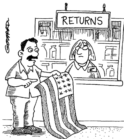
"Have you got any that aren't flame retardant?"

Bros, Thomas (2006): Good news men, we'll be getting the flagpole tomorrow . [Online: http://www.cartoonstock.com/cartoonview.asp?start=2&search=main&catref=tbrn139&MA_Artist=&MA_Category=&ANDkeyword=american+flag&ORkeyword=&TITLEkeyword=&NEGATIVEkeyword ; 29.07.2013].