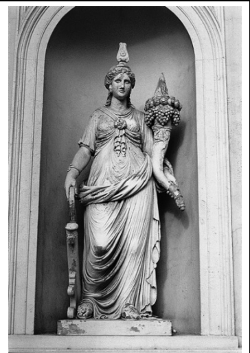
Abbildung: Antikisierende Fortuna mit Füllhorn als Fassadenfigur